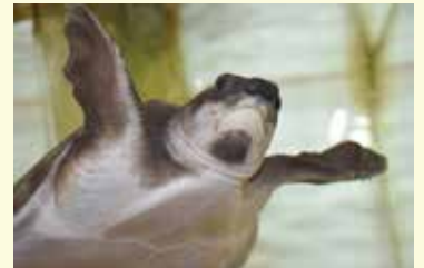
泳ぐ姿はまるでウミガメのようです

熱帯魚の飼育です。学生の頃から大好きで色々な種類の魚を飼育してきました。開業後も事務所内に水槽を複数設置して、アロワナやナマズなどの怪魚を十数匹飼育していましたが、スタッフの数が増えるにつれて水槽の設置スペースも限られてきたことから、泣く泣く水槽を減らし、今は「スポンモドキ」というカメの飼育にとどめています。甲長が30cmを超えるほどに成長してきて、私になついてくれる可愛いカメです！ちなみに、名前の通り見た目はスポンに似ていますが、鍋にして美味しいのかは分かりません(笑)