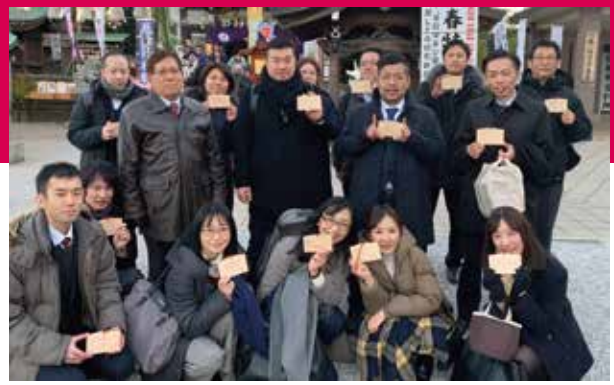
司法書士 5名、スタッフ 11名 (2020年3月末時点)